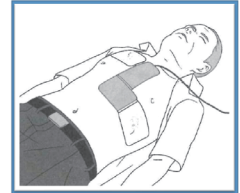
《電極パッドが一体のタイプ》